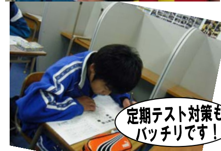
定期テスト対策もバッチリです！