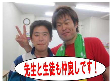
先生と生徒も仲良しです！