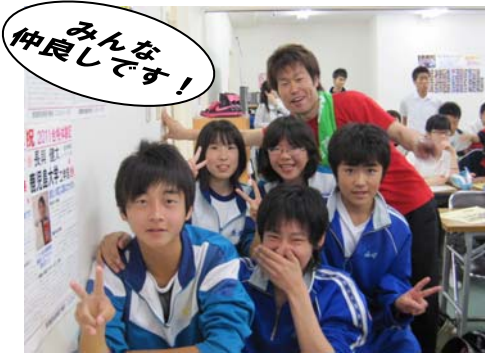
みんな仲良しです！