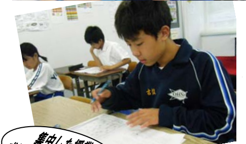
集中した授業が成績UPにつながります！