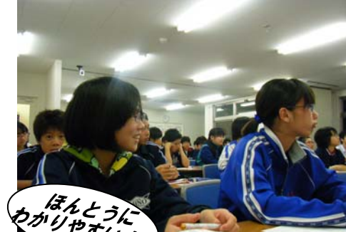
ほんとうにわかりやすいよ。